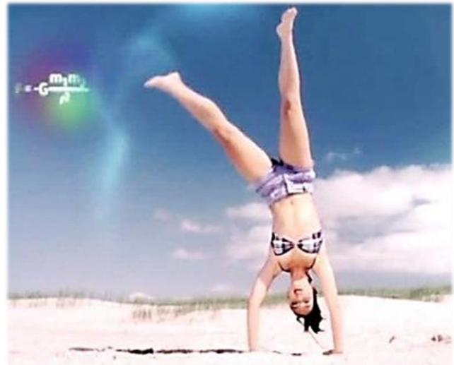
Ausschnitt: Quarks & Co, Motiv aus dem Trailer der Sendereihe