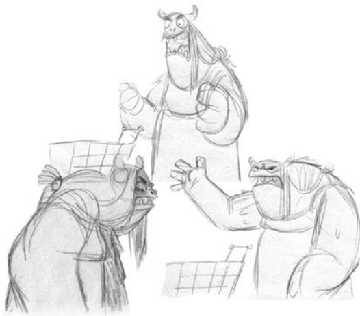
the little boy and the beast